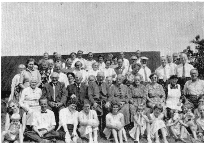
Foto over Deltagere i det sidste Stævne paa Slusemøllen, August 1959.

Derefter sang vi en ny stævnensang, — "Sion, du Guds stad."